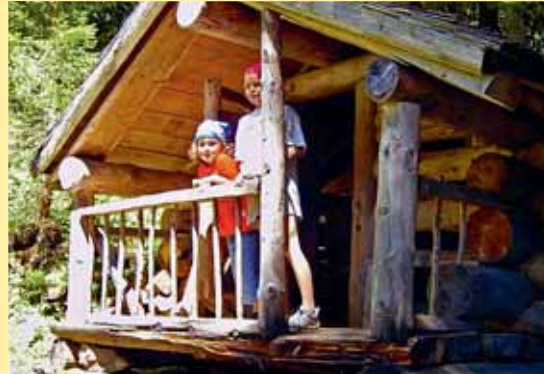
Wann war Zwärg Baartli das letzte Mal hier?

Wenn du noch nicht so gross und stark bist, um alle Abenteuer mitzuerleben, kannst du den Weg «Zwärg Baartli und die Melodie des Sommers» besuchen.